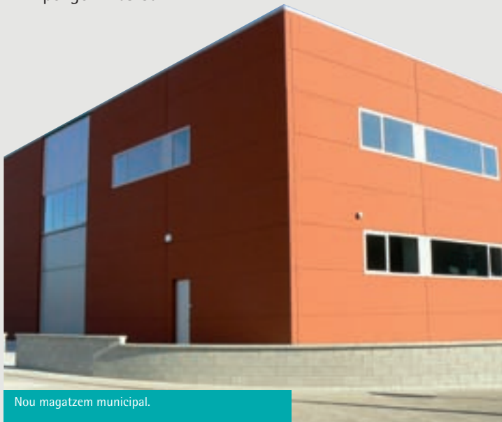
Nou magatzem municipal.

Té una superfície de 285 m 2 de planta i un entresolat de 135 m 2 , que es distribuïran en diferents departaments per a magatzem i arxiu per a l'Ajuntament i, si cal, també per a entitats. És de fàcil accés, amb portes grans a l'entrada i a la sortida al davant i al darrera que permeten poder carregar i descarregar sense necessitat de maniobrar. Està ubicat al polígon Mas Galí.