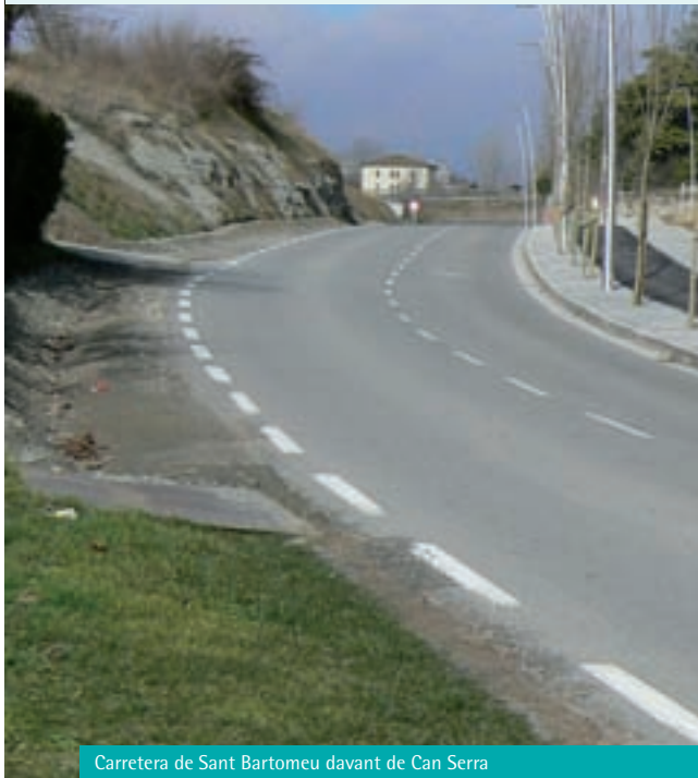
Carretera de Sant Bartomeu davant de Can Serra

La Diputació de Barcelona està redactant el Projecte d'urbanització de la carretera de Sant Bartomeu. El passat desembre va presentar un avantprojecte que preveu la remodelació de tot el tram, des de l'Ajuntament fins al Pavelló, executable en diverses fases. Com recordaréu, l'Ajuntament va acceptar la cessió de la carretera del tram que va des de l'Ajuntament fins a la primera rotonda de l'Eix.