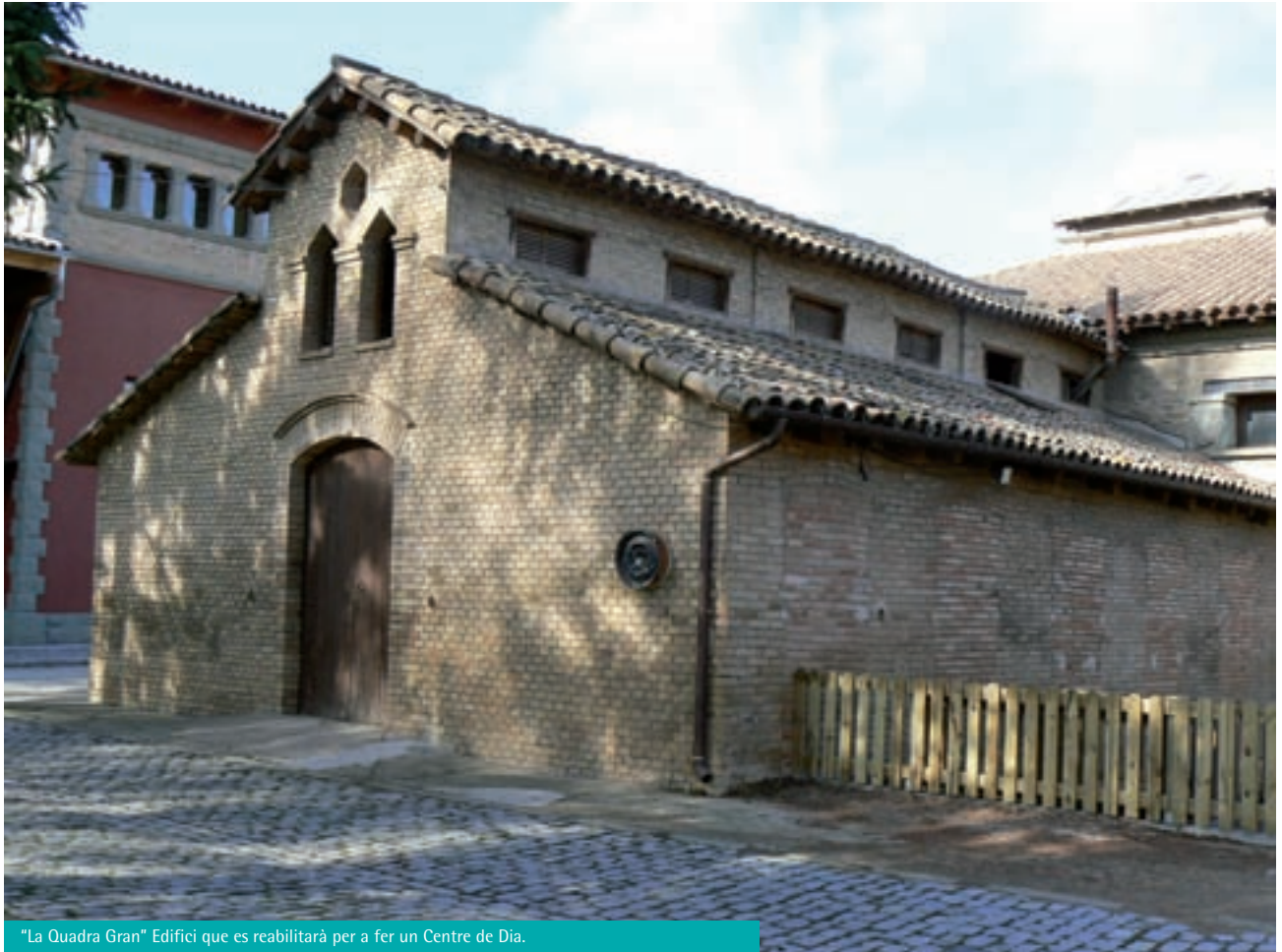
"La Quadra Gran" Edifici que es rehabilitarà per a fer un Centre de Dia.

Amb el nou Fons Estatal d'Inversió Municipal, l'Ajuntament ha acordat destinar-ne el 80% a la rehabilitació de la "Quadra Gran" per ubicar-hi un Centre de Dia. Aquest edifici, situat en el recinte de l'Esperança, entre el Casal de la gent gran i el Teatre, té una superfície de 110 m 2 i fins fa poc s'utilitzava de magatzem i està força deteriorat. La reforma serà integral i en consonància amb tot el recinte de l'Esperança. Es rehabilitarà tota l'estructura i s'hi faran les obertures que antigament hi havia, tot conservant-ne l'estructura actual.