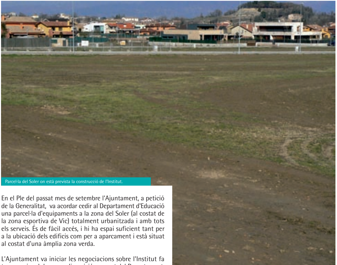
Parcel·la del Soler on està prevista la construcció de l'Institut.

El passat mes de desembre el Departament d'Educació va publicar al Diari Oficial de la Generalitat (DOG) l'oferta educativa del nou centre de Gurb (SES Gurb 08068380), el qual s'ubicarà a la zona prevista del Soler en aules prefabricades fins que es construeixi el nou edifici. Després d'intenses negociacions amb el Departament d'Educació, és molt possible que Gurb tingui un SES Secció Ensenyament de Secundària (ESO) que també serà per a alumnes de Sant Bartomeu del Grau i de Santa Eulàlia de Riuprimer.