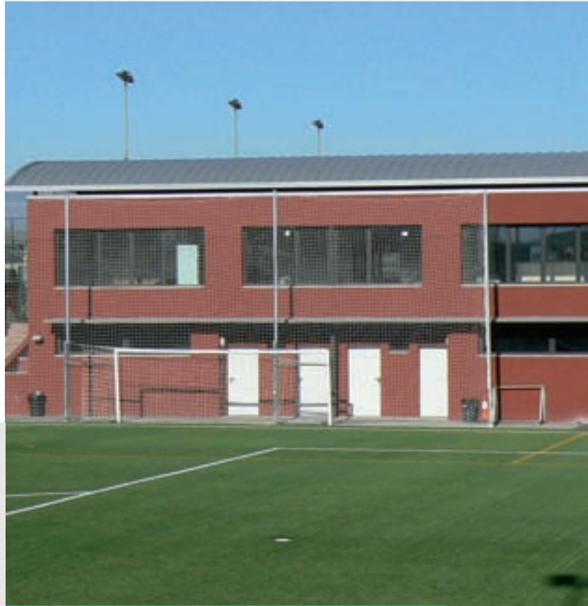
Nous vestidors, bar i local social.

També han finalitzat les obres, amb un cost de 235.000 euros finançat íntegrament pel Fons Estatal, excepte el projecte.