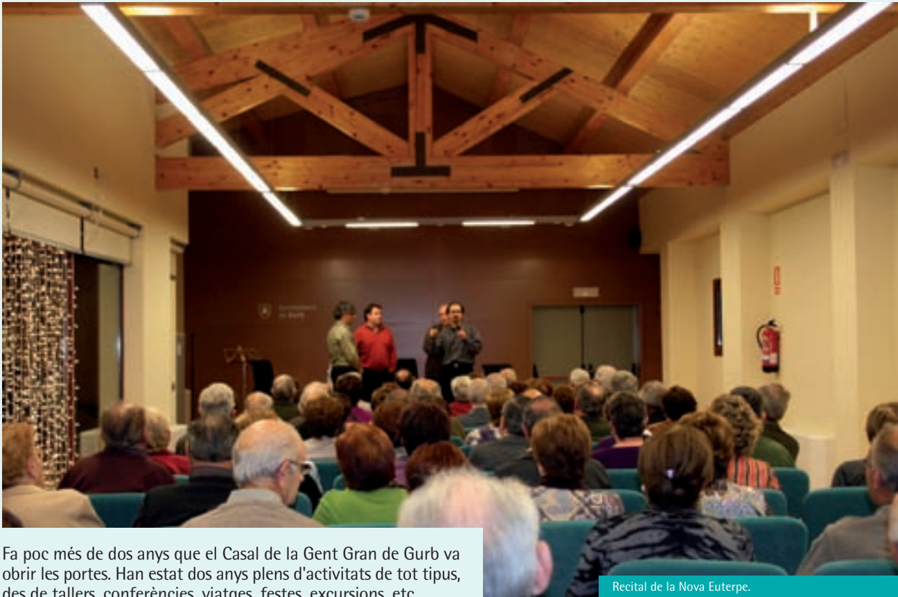
Recital de la Nova Euterpe.

Fa poc més de dos anys que el Casal de la Gent Gran de Gurb va obrir les portes. Han estat dos anys plens d'activitats de tot tipus, des de tallers, conferències, viatges, festes, excursions, etc.