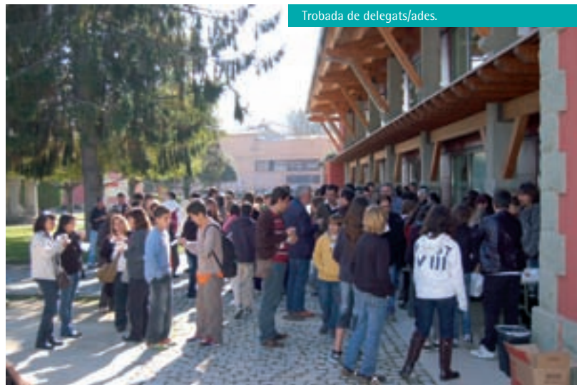
Trobada de delegats/ades.

Va ser una jornada plena d'activitats culturals i formatives. Gurb va liderar la trobada i va cedir tots els espais necessaris per a l'ocasió amb un gran èxit de coordinació. Aquesta activitat ha estat subvencionada per la Diputació de Barcelona i el Consell Comarcal.