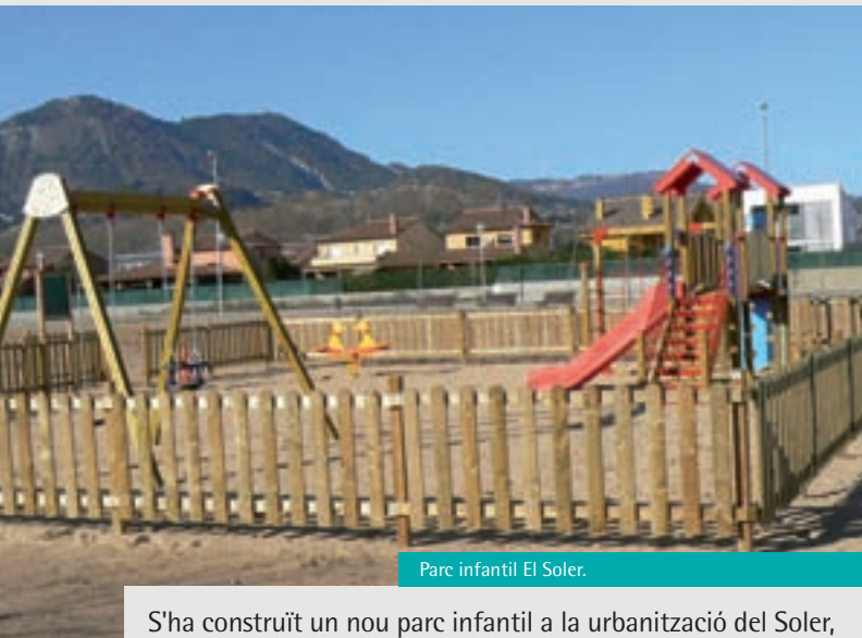
Parc infantil El Soler.

S'ha construït un nou parc infantil a la urbanització del Soler, s'han remodelat i ampliat els de la plaça de l'Amistat i el del carrer Diagonal i s'ha construït una sorrera davant la Il·la d'infants.