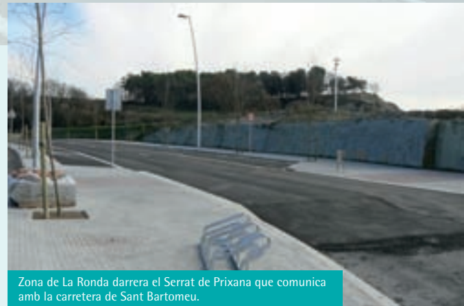
Zona de La Ronda darrera el Serrat de Prixana que comunica amb la carretera de Sant Bartomeu.

El projecte preveu que la carretera es converteixi en un carrer. En algun punt es desplaça un metre a la dreta i en algun altre a l'esquerra, i fa algunes ziga-zagues amb l'objectiu d'evitar-hi la velocitat. Aquests desviaments, a efectes òptics, gairebé no es perceben, però provoquen la reducció de la velocitat i alhora fan més fàcil adaptar la urbanització a la realitat actual. També preveu més de 10 passos per a vianants i on actualment hi ha el semàfor (que s'elimina) la carretera estarà una mica aixecada també per evitar la velocitat a la cruïlla entre el carrer del Castell i la plaça de l'Amistat que serà més ampla.