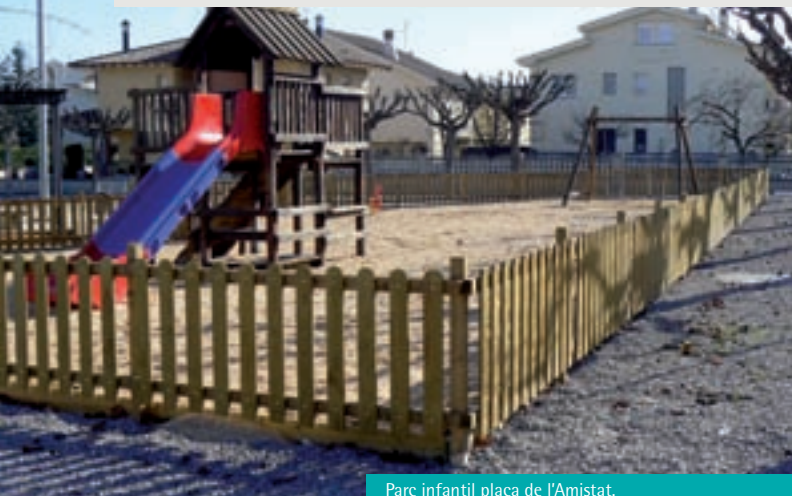
Parc infantil plaça de l'Amistat.

Gurb ha fet un pas important en equipaments públics destinats als més petits, repartits per totes les zones urbanes: Serrabonica, carrer de Sant Roc, davant de les Escoles, plaça de l'Amistat, el Soler, carrer Diagonal.