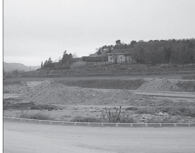
Terrenys on s'ubicarà la futura escola de Gurb

Des de fa unes setmanes, diverses cases de pagès de Granollers de la Plana s'han vist afectades per alguns robatoris consistents en la sostracció d'eines i estris diversos. Per aquesta raó sembla oportú demanar que es posi la màxima atenció per estar alerta en cas d'observar conductes o moviments estranys. Així mateix, aprofitem per recordar el número de telèfon dels Mossos d'Esquadra per si us fos d'utilitat (93 886 08 45) i, en qualsevol cas, es recomana la presentació de la corresponent denúncia si es produeix algun robatori.