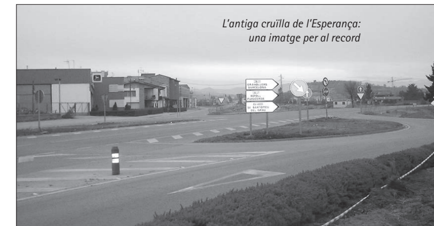
L'antiga cruïlla de l'Esperança: una imatge per al record

ciutadans del municipi, que denunciaven la perillositat del tram, tot i que momentàniament s'havia intentat alleugerir el problema amb la construcció d'un pont al carrer Sant Roc, que connecta la carretera de Sant Bartomeu amb la zona esportiva de Vic.