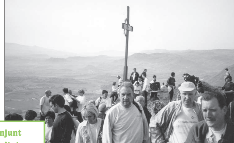
La caminada del dia 1 de maig va ser un èxit de participació

pi a partir de les històries i llegendes que s'han explicat al llarg dels anys. És de destacar que aquestes conferències van comptar amb un nombre molt satisfactori d'assistents. Entre tant, el dia 1 de maig, en el context de la tradicional Caminada popular al Castell de Gurb, en la qual enguany van participar més de 350 persones, es va inaugurar una esplèndida Taula d'Orientació per commemorar el centenari.